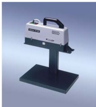
350 DSM (Standardgerät)