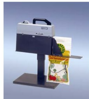
350 DSM-H (Sondergerät)

ALLPAX GMBH & CO. KG SÄGEÜHLENSTRASSE 89 D-26789 LEER