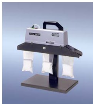
350 DSM-TE m. Trageeinrichtung