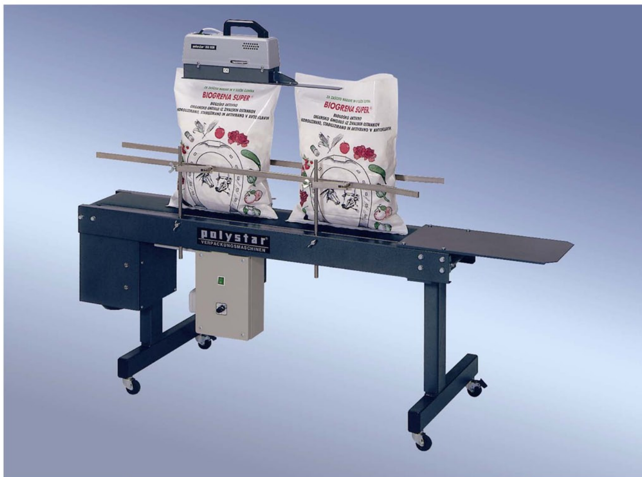
polystar® 350 DSM mit fahrbarem Transportband

Durchlauf- Schweißgeräte für Polyethylenfolien