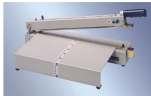
polystar® 423 M mit SV + AT

ALLPAX GMBH & CO. KG SÄGEÜHLENSTRASSE 89 D-26789 LEER