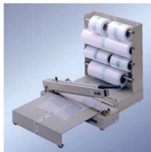
243 M m. SV, Magazin + AT